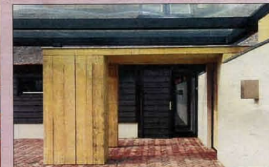
De entree van het tuinhuis.