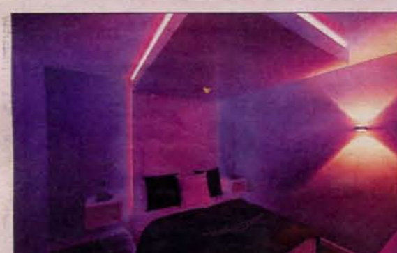
Ook de slaapkamer is tot in detail ingericht.