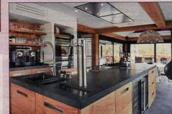
Een keukeneiland met bar en televisiehoek.