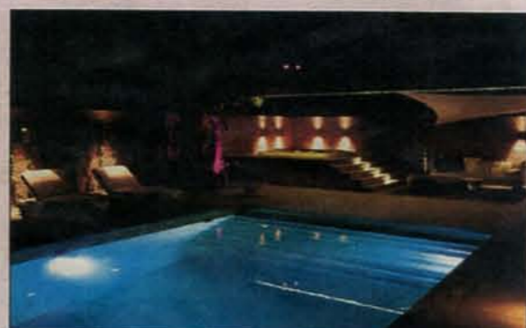
Het zwembad: dankzij een UV sterilisator in combinatie met AFM is er nagevoel geen chloor meer nodig voor de zuivering van het water.