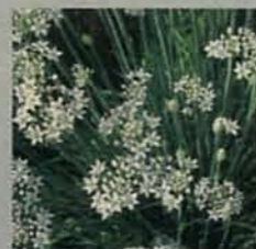
Allium tuberosum.

I k krijg nogal eens planten cadeau. In negen van de tien gevallen weet ik niet wat ik ermee aan moet. Meestal zijn het planten waaraan ik geen behoefte heb, maar een gezonde plant gooi je natuurlijk niet zomaar op de composthoop. Gelukkig zijn er tal van manieren om een plant dood te krijgen, waarna je hem zonder wroeging kunt weggoien. Vooral vorstgevoelige planten zijn een uitkomst. Je hoeft alleen maar te vergeten die aan het begin van de winter af te dekken. Maar een enkele keer ontstaan er pijnlijke situaties. Zo kan het gebeuren dat de gulle gever komt kijken wat er van zijn gift geworden is. Dan moet je snel improviseren en bijvoorbeeld met een grafstem melden dat de plant - juist toen hij de smaak te pakken had en begon uit te groeien - door die dekselse honden is uitgegraven omdat ze dachten dat er een konijn onder school. Jack Russells hè, altijd ongehooorzaam.