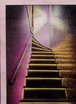
De verlichte trap naar boven.