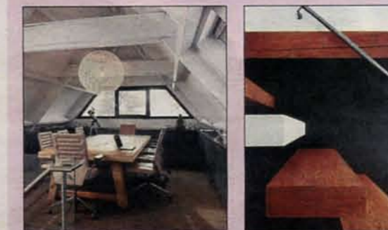
Het kantoor op de eerste etage.