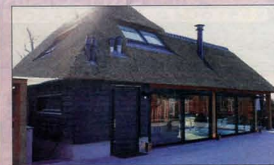
Het tuinhuis - 'schuur' kun je het eigenlijk niet noemen.'

de verwarming lager zetten, de zwembadtemperatuur regelen en een muziekje kiezen. „Dit is echt domotica waarvoor domotica bedoeld is”, vertelt Verheijen met gepaste trots. Grappig detail is dat het tuinhuis maar liefst zeven kilometer aan loze leidingen telt. Voor de zekerheid waren er vóór het beton storten ruim voldoende gelegd, maar tijdens de bouw - die een jaar in beslag nam - bleken sommige niet meer nodig (en op andere plaatsen waren er toch nog te weinig). Concessies zijn hier niet gedaan: alles moest 100% naar wens van de bewoners. Met het beschikbaar komen van nieuwe technieken veranderden ook die wensen van de opdrachtgever, die met zijn grote betrokkenheid iedereen wist te motiveren. Becht: „Hij stond steeds met een grote glimlach tussen iedereen in. Dat geeft een heel andere energie dan bij een reguliere bouw.”